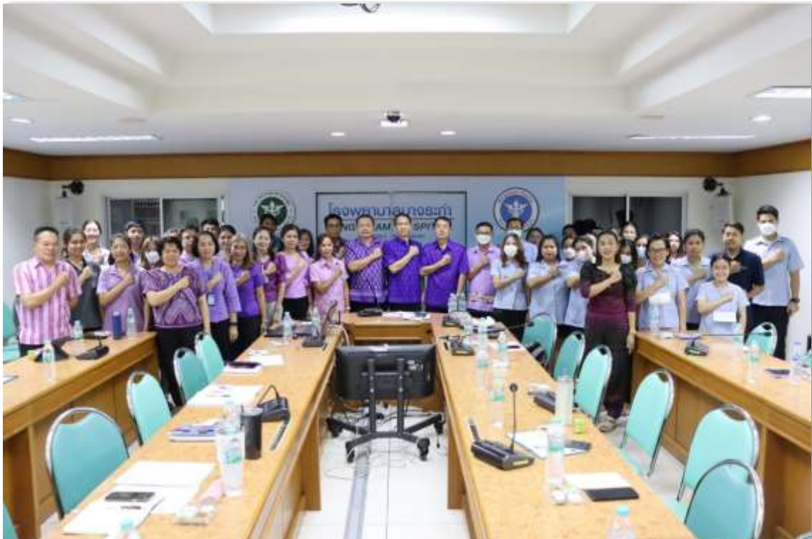
ผู้เข้าร่วมประชุมแสดงเจตนาสมัครต่อด้านการทุจริตฯ